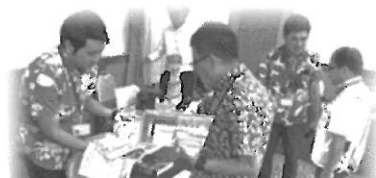
企業PR、情報交換の様子

ご不明な点がございましたら事務局まで問い合わせください (TEL098-861-4166)